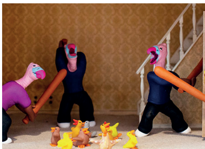
Clara Marciano, Du plomb dans l'aile , 2019, coll. de l'artiste

Le Art et marges musée, c'est une collection d'œuvres créées dans les marges de l'art !