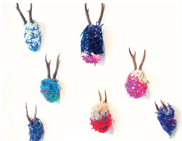
Laura Delvaux, coll. La 5 Grand Atelier

L'expo « Lisières » rassemble des œuvres qui nous parlent de notre lien à la nature. L'animal, le végétal, le minéral et même l'eau y sont présents à travers les œuvres d'une quarantaine d'artistes !