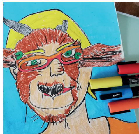
Rémy Pierlot, coll. La 5 Grand Atelier